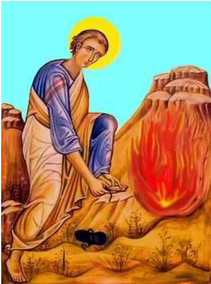
«Mosè e il roveto ardente» icona tradizionale bizantina

Domandiamoci innanzitutto: cosa vogliono rivelarci questi Dieci Comandamenti? Lo vedremo. Essi ci mostrano ovunque, non solo nella prima parte ma anche in una maniera apparentemente velata nell’ultima, lo spirito con cui Mosè ha parlato al popolo ebraico, rivelando loro quella potenza che doveva ormai essere