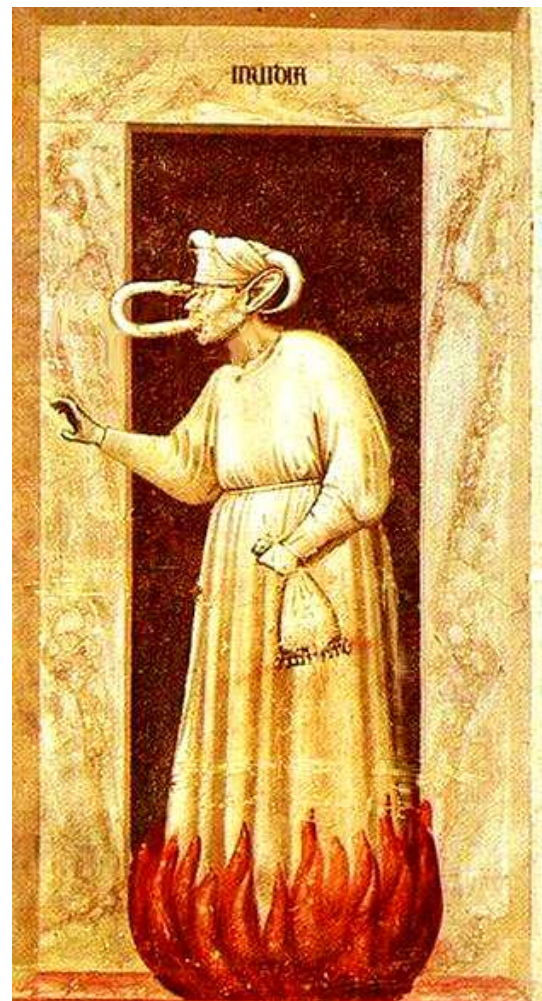
Giotto «L'invidia» Cappella Scrovegni, Padova

Allo stesso modo, quando qualcuno odia il suo prossimo, lo disprezza calunniandolo, indebolisce la forza del proprio Io, indebolisce la forza vitale, la salute di chi lo circonda. Accade lo stesso per l'invidia → dei beni altrui. Concupire il bene altrui, costituisce già un indebolimento della forza dell'Io. Uguale osservazione è valida riguardo al Decimo Comandamento: l'uomo indebolisce il suo Io quando getta uno sguardo invidioso sui progressi altrui, invece di sforzarsi di amarlo, lasciando in tal modo espandersi la sua anima e crescere la forza del suo Io.