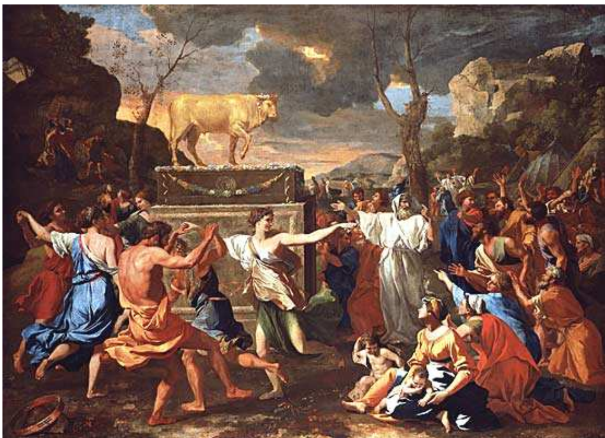
Nicolas Poussin «Adorazione del vitello d'oro» National Gallery, Londra

Ma ciò che fa dell'uomo il coronamento della creazione, il suo Io, nessuna immagine esteriore può esprimerlo. Per questo occorre far capire al popolo ebraico in pieno rigore e con forza: qualcosa in te è l'emanazione diretta del Dio che al presente è il più elevato. Ciò non potrebbe essere simbolizzato con un'immagine ricavata dal regno minerale, vegetale o animale, per quanto possa essere sublime. Pertanto, tutti gli Dei davanti ai quali ci si inchina sono inferiori a Colui che vive in te. Se tu vuoi onorare quel Dio, occorre che gli altri scompaiano. Possederai allora la sana, la vera forza dell'Io in te.